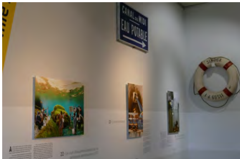
Vue d'une des salles de l'exposition