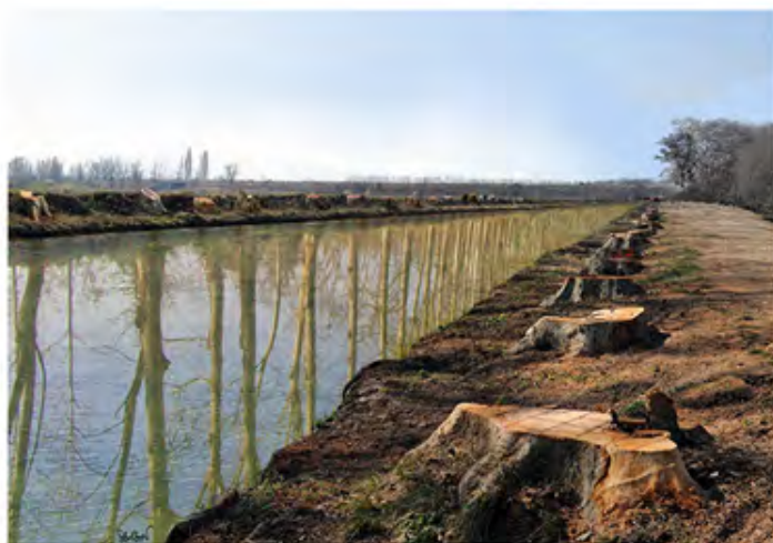
La mémoire de l'eau

Les photomontages et l'exposition permettent d'appréhender de manière critique les images d'aujourd'hui. Ils interrogent sur le contexte et le sens d'une image et sur l'utilisation des outils numériques comme moyen de détournement des images. Quel statut et quel crédit accorder à l'image à l'ère du numérique ?