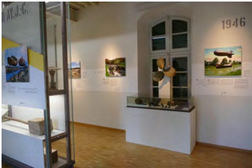
Vue d'une des salles de l'exposition

L'exposition est le point de départ de la visite des élèves avant même la découverte du musée. En effet, elle déploie un regard décalé sur l'histoire du canal du Midi. Elle amène le visiteur à s'interroger sur la part du possible et de l'imaginaire. Elle met en tension les époques.