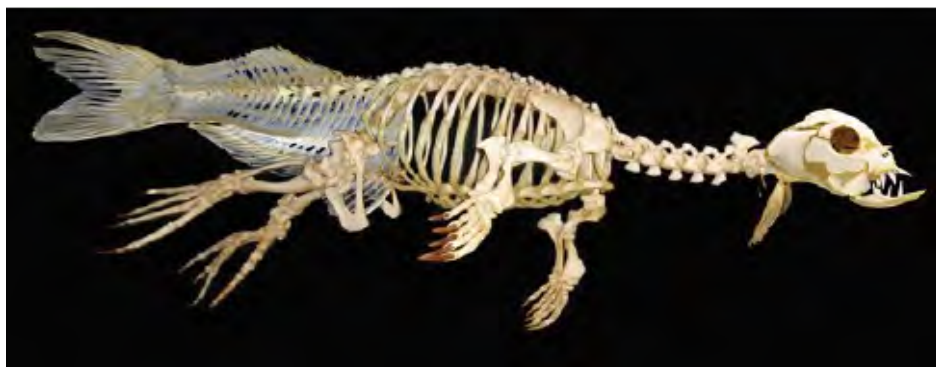
Squelette reconstitué du Pinnilupusambrax pierrepaulriqueti

Tout est faux dans cette exposition, mais tellement cohérent que le farfelu pourrait se substituer à la réalité.