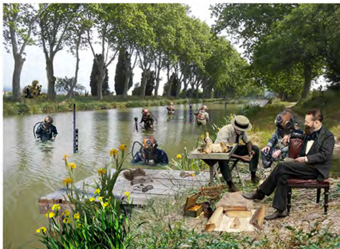
La cartographie des fonds du canal et la découverte du trésor gaulois